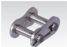
Nr. 11/E: Steckglied mit Federverschluss