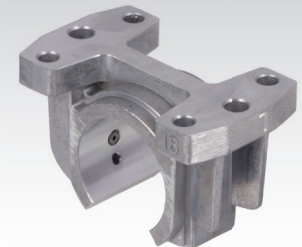
Linearlager (Kugellagerbuchse oder Gleitlagerbuchse) muss separat bestellt werden.

Werkstoff: Aluminium-Druckguss. Leichte Gehäuse für offene Linearlager der ISO-Serie 3 (Linearlager muss separat bestellt werden).