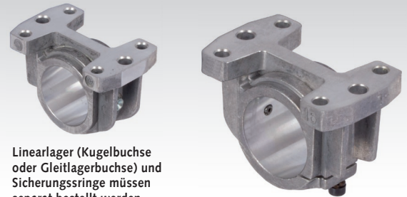
Linearlager (Kugellagerbuchse oder Gleitlagerbuchse) und Sicherungsringe müssen separat bestellt werden.

Werkstoff: Aluminium-Druckguss. Leichte Gehäuse für geschlossene Linearlager der ISO-Serie 3 (Linearlager muss separat bestellt werden).