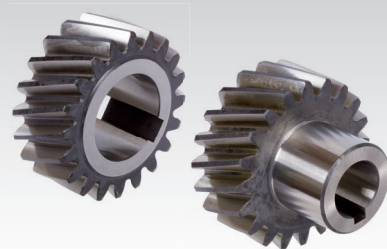
Obrázok 1 Obrázok 2