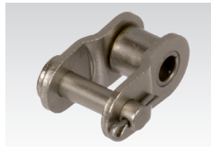
Nr. 12/L: gekröpftes Glied mit Splintverschluss