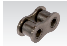
Nr. 4/B: Innenglied