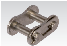
Nr. 11/E: Steckglied mit Federverschluss

Bestellangaben: z.B.: 5 Stück Artikel-Nr. 100 668 03, Verschluss Nr. 11/E, 05 B-1, vernickelt