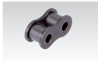
č. 4/B: Vnútorný článok (Potrebné 3 kusy)