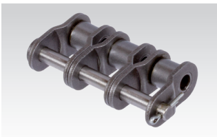
č. 12/L: Zalomený článok s závlačkou