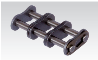
č. 11/E: Spájací článok s pružným klipom