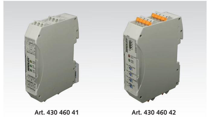
Art. 430 460 41

Bestellangaben: z.B. Art.-Nr. 430 460 41, Motorsteuerung