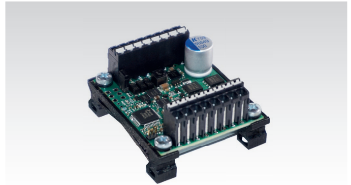
Bestellangaben: Art.-Nr. 430 460 06, Regelgerät SFRG 06

Auch als Ausführung mit CANopen-Bus erhältlich (Sonderartikel mit erweiterter Hardware).